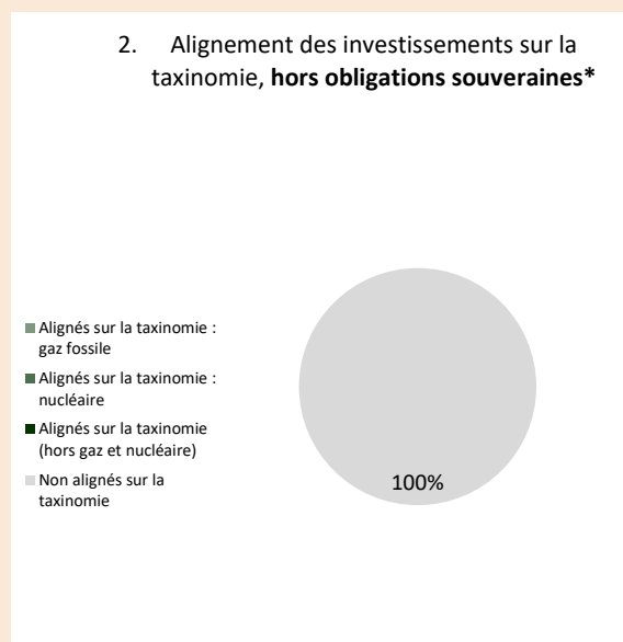
Ce graphique représente 100% des investissements totaux

*Aux fins de ces graphiques, les «obligations souveraines» comprennent toutes les expositions souveraines.